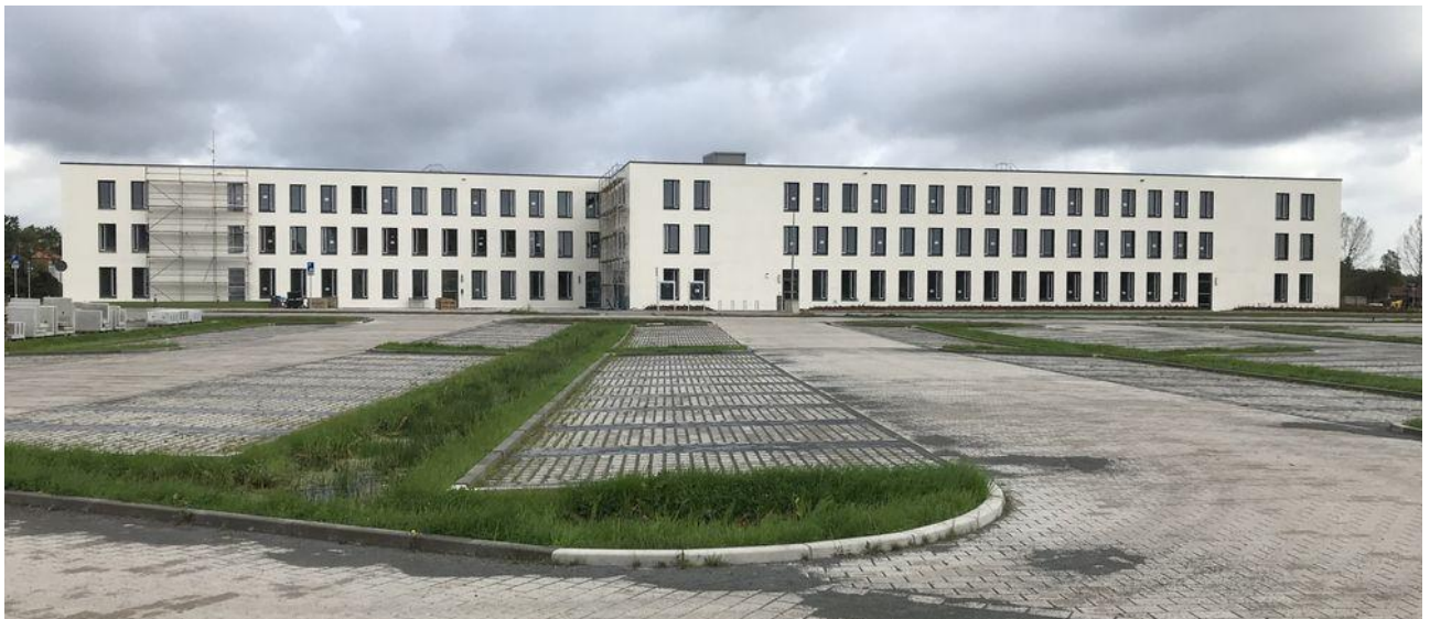
Die südliche Fassade des Kreishauses, davor befindet sich ein Parkplatz

Der erste planmäßige Sprechtag im Neubau Bornsche Straße wird am Dienstag, 24.10.2017, von 08:00 bis 12:00 und von 13:00 bis 18:00 Uhr, durchgeführt. Für Besucher wird das Haus erstmalig am Montag, 23.10.2017, geöffnet. Genau zu diesem Zeitpunkt wäre die erste Phase des Umzuges abgeschlossen.